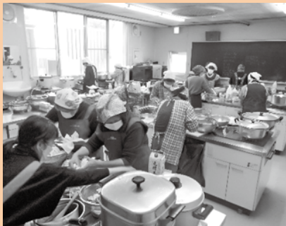
▲ 調理ボランティア4団体合同作業

配食調理・配達ボランティアに参加してみたい方は、社会福祉協議会までお気軽にお問い合わせください。