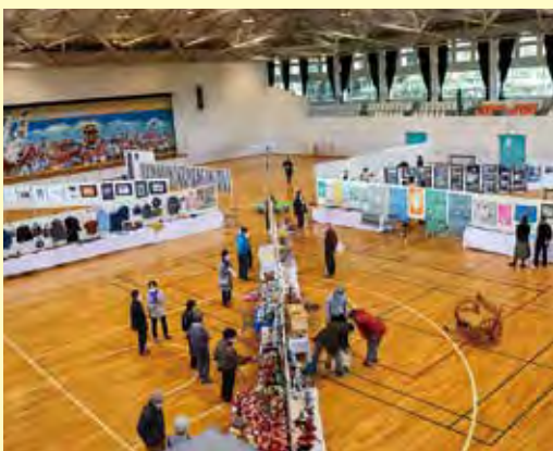
▲文化祭 会場の様子