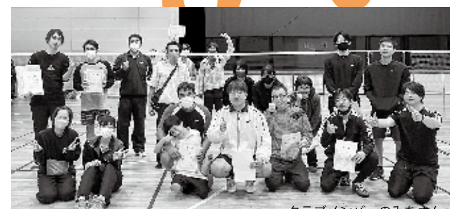
クラブメンバーのみなさん

コロナ禍を経て約3年ぶりに開催となったこの大会でしたが、元気に30組60人の参加者を迎えて開催となりました。今回から新しく「レジェンド・ビギナークラス」を設け、老若男女問わずより一層の熱戦が繰り上げられることとなりました。当日はどの参加者も必死に、そして楽しそうにコート狭しとフットワークを使い、ラケットを振り、勝敗に関わらず楽しく、充実した一日を過ごしました。なお、次回大会は2月5日(日)に開催予定、こちらにもたくさんの参加者を迎えるべく、大会を運営する一宮町バドミントンクラブのメンバーも今から張り切っています。なお、バドミントンに興味を持った方は練習の見学や体験も大歓迎です。運動できる服装と上履きがあれば結構ですので、お気軽に足を運んでください。