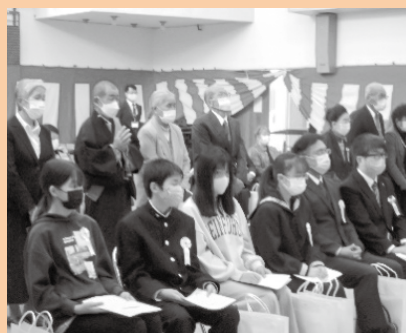
▲ 功労者および優秀者の方々