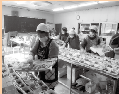
▲ お弁当完成までもう少し