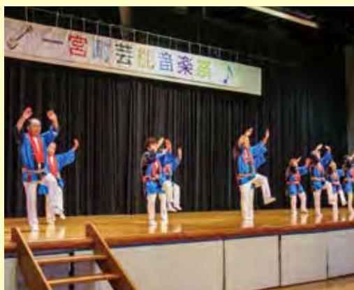
▲芸能音楽祭 つくも会の熱演