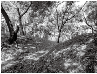
▲高藤山城山頂の堀 (一宮 7473)

つまり、最新の研究成果では、高藤山城跡は広常の居城ではない可能性が高い、ということになります。ただ、高藤山城跡は遺構がよく残っており、戦国時代の城という観点で見ると、良い山城であるといえるでしょう。そしてまた、郷土の歴史を後世に伝えようと建てられた石碑も、当時の人々の思いを今に伝える、重要な史跡であることは間違いありません。