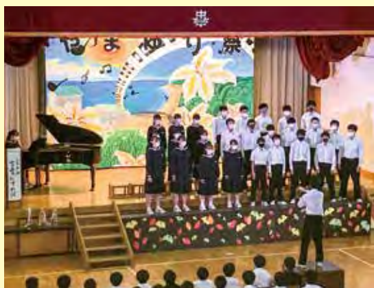
最優秀賞 B組「言葉にすれば」