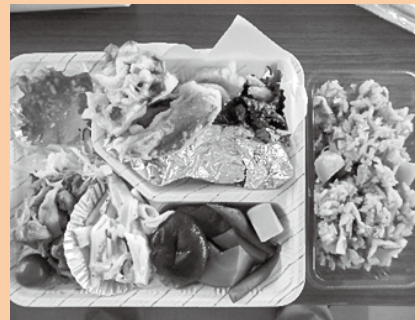
▲ おいしいお弁当完成