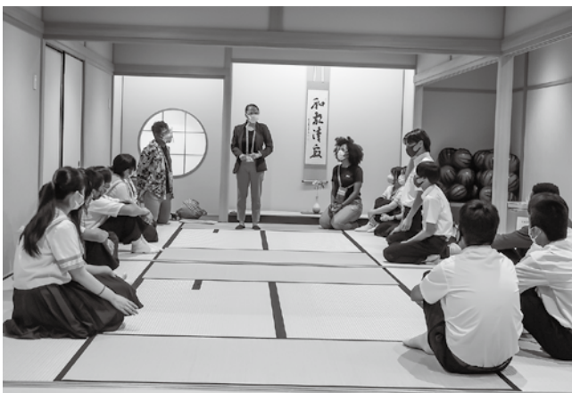
▲おもてなし文化を学び、紹介し合う様子