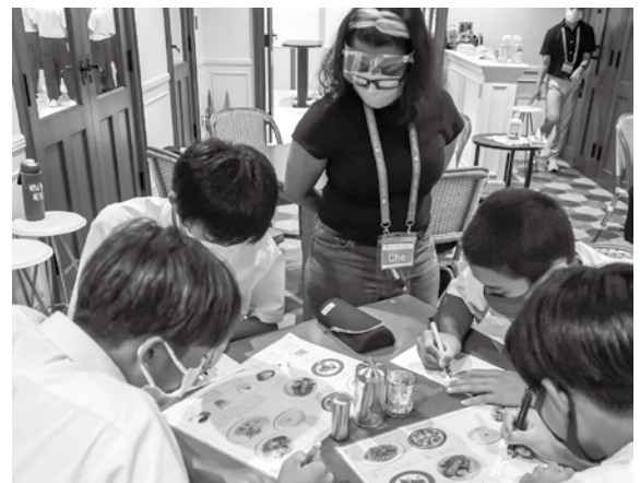
▲ファストフード店で注文の練習をする様子