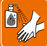
手洗い・除菌をします