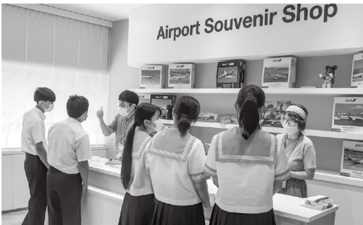
▲空港でお土産を買う練習の様子