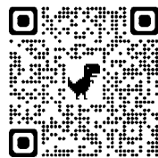
▲日本防災士機構 ホームページ