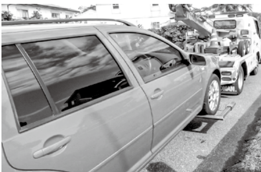
▲差押え自動車の引揚げ例