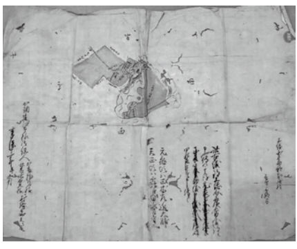
▲高藤山城の絵図 (一宮町教育委員会所蔵 享保11年(1726)制作。「上総介広常」の記述がみえる。)

この宣旨、さらに広常の謀殺は、頼朝と御家人との間の「御恩」と「奉公」という主従関係の確立が進行する契機となります。そういう意味では、広常の死は鎌倉幕府成立への一つの転換点だったともいえるでしょう。