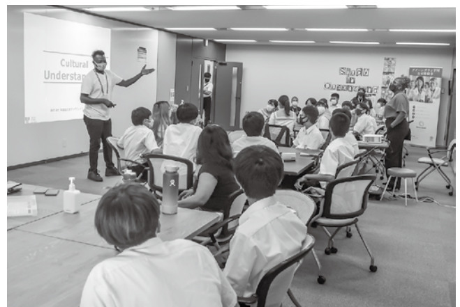
▲多文化理解に取り組む様子