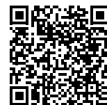
東京国税局ホームページ 【採用関係お役立ちリンク集】