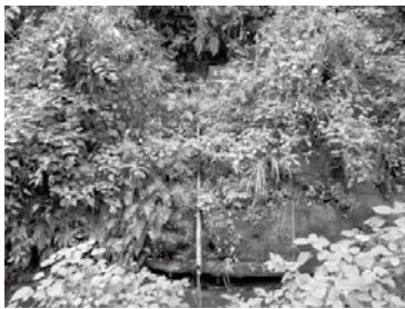
▲太刀洗の水 神奈川県鎌倉市。2018年10月広常を切った景時が ここで刀を洗ったという。

真)は伝広常屋敷跡の近くにあるため、上総氏屋敷内で広常の謀殺が行われた可能性も否定できません。ただ上総氏屋敷内で当主の広常の謀殺が成功できるとは考えにくく、ひょっとしたら御所内で広常が謀殺されたのち、広常の屋敷を梶原らが攻撃し、そののちに太刀を洗った、という構図も考えられなくはありません。しかしその場合でも広常の家臣らが討ち取られたという記述や伝承はないため、上総氏屋敷には能常があり、そこで能常が討ち取られたもしくは自害したという可能性も推測されます。