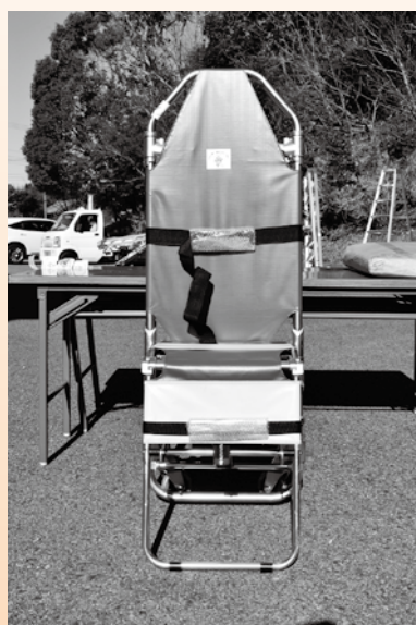
▲アシストストレッチャー