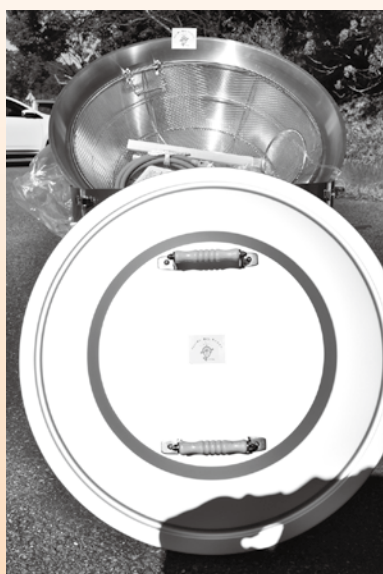
▲ 炊出用かまどセット