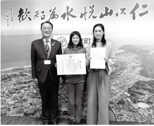
▲ 左から、寺田さんとお母様