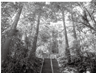
▲東浪見寺へ続く参道