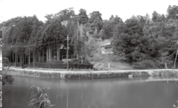
▲軍荼利山(南東より)

これらの植物は「軍荼利山植物群落」として、昭和32年(1957)1月17日に県の指定天然記念物に指定されています。