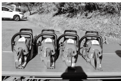
▲ エンジンチェンソー