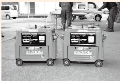
▲ インバータ発電機