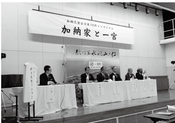
▲ パネルディスカッションの様子

4人の講師による講演とパネルディスカッションが行われ、久宜公の業績を学ぶ機会となりました。