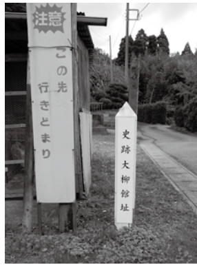
▲大柳館跡の標柱 (睦沢町北山田 235 付近)

一宮町において、上総千葉氏の痕跡は残念ながら確認できていません。しかしながら、上総氏の地盤を引き継いでいる点、本拠地が大柳館であった点を考えると、上総国一之宮である玉前神社の所在する地域は、上総千葉氏にとって重要な場所であったといえます。