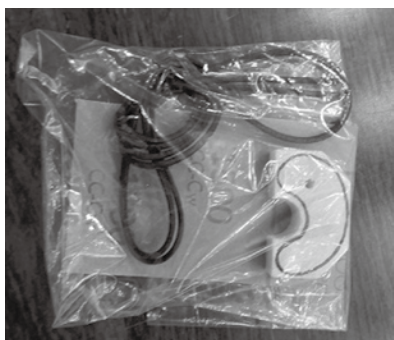
▲ 当日使用した勾玉作成キット

勾玉とは古代の日本における装身具の一つです。多くはC字の形に湾曲した玉から尾が出たような形をしています。