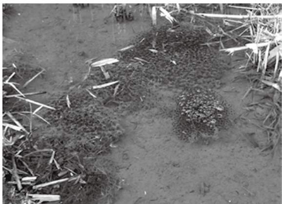
▲アカガエルの卵塊