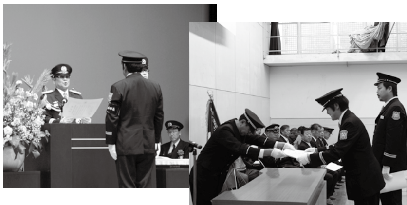
【受章する消防団員たち】