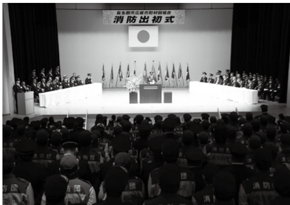
【長生村文化会館で開催された消防出初式】