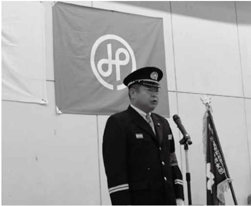
【あいさつをする支団長】

受章された皆さんおめでとうございます。また日頃から消防活動にご理解をいただいているご家族の皆さんに感謝申し上げます。