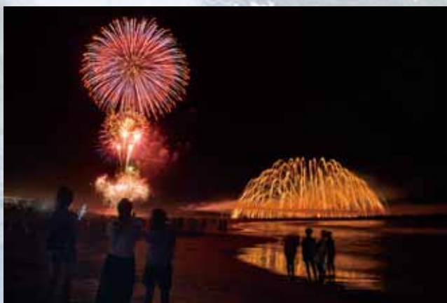
③ 特選 「フィナーレ」