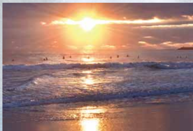
⑤ 入選 「初日の出」