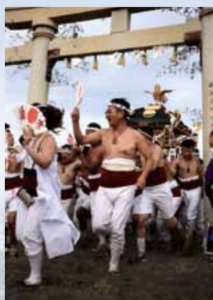
④ 特別賞 「祭りだ ワッショイ」