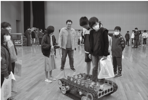
▲実際にロボット体験をする児童たち