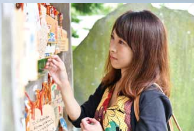
⑦ 入選 「あなたの願いが叶いますように」