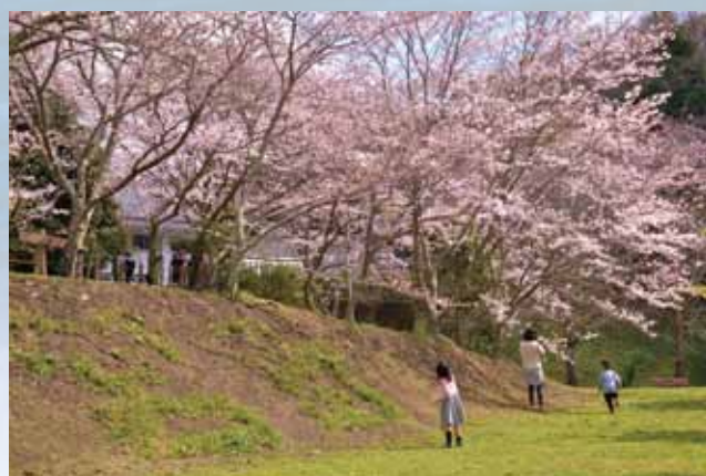
⑥ 入選 「咲いたね うれしいなあ」