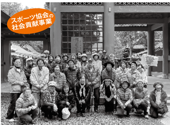
スポーツ協会の 社会貢献事業

エンジョイススポーツクラブ初冬の郊外ウォーキングは、12月1日(日)、霞ヶ浦周辺の神社仏閣を巡るコースで行われました。町民バス一宮号の定員いっぱいの総勢31名は20歳代から83歳までの老若男女の顔ぶれ、賑やかに一宮町を出発しました。最初は鹿島神宮にお参りし、荘厳な杉並木が続く境内を散策。その後霞ヶ浦を臨む天王崎公園でランチタイム。晴れ渡った空の下、華やかなお弁当を広げて寛ぎました。午後は牛久大仏から香取神宮を廻り、御朱印を新たな頁に加えた方も多くいました。とくに香取神宮は本宮まで長い坂道となっていました。参加者みんなで元気にお参りを終え、全員が無事に帰路に着くことができました。当クラブでは町民の体力維持や健康増進を目的に、誰でも参加できる郊外ウォーキングを年4回行なっています。次回は3月8日に都内で空中散歩を楽しむコースを予定しています。小学生以上の皆様の参加をお待ちしています。