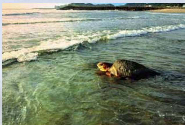
① 観光協会長賞 「命託して」