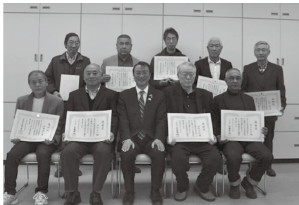
長い間ありがとうございました

相談がある場合は、内容に応じて隣の委員の紹介や、適切な機関への紹介を行います。また、欠員となつている地区の候補者の推薦について、皆さんの情報提供をお願いします。