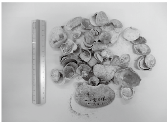
▲貝殻塚貝塚出土の貝類と伝わる。(一宮町教育委員会所蔵)

千葉県は海に面している地域が多く、県内各地に多くの貝塚があります。千葉市の加曾利貝塚は平成29年(2017)に国の特別史跡に指定されています。さらに、袖ヶ浦市の山野貝塚が、平成29年(2017)に国の史跡に指定されており、貝塚は千葉県の縄文時代を語る上で欠かせないものだといえるでしょう。