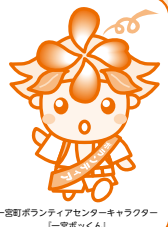
一宮町ボランティアセンターキャラクター 「一宮ボックン」

連絡先 社会福祉法人一宮町社会福祉協議会 ☎ (42) 3424 一宮町ボランティアセンター ☎ (42) 3439