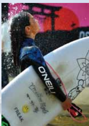
② 町長賞 「次も勝ちたい」