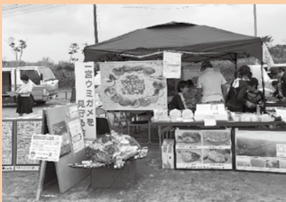
▲ 町内外のイベントにも参加しています

ウミガメが産卵できる一宮町の豊かな自然環境を守るために、ゴミをポイ捨てしない、目の前のゴミを拾う、そして広く皆さんに伝える活動など、私たちにできることを続けていきたいと思っています。