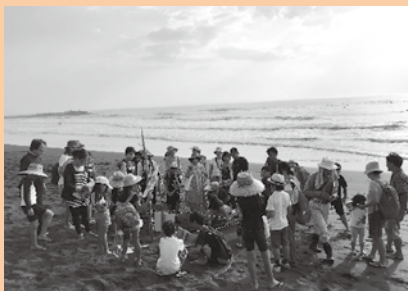
▲ ウミガメの巣の観察会の様子