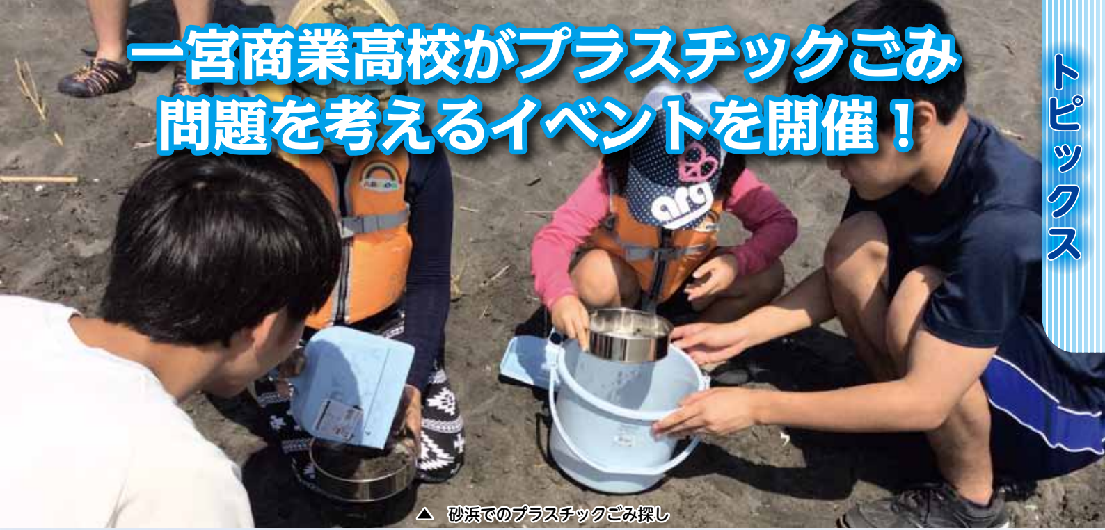
▲ 砂浜でのプラスチックごみ探し

県立一宮商業高等学校「課題研究」ビジネス研究班の3年生が、一宮海岸で、プラスチックごみ問題について考えるイベント「3E Eco! Energy! Enjoy!」～プラごみはかせになるっ～」を8月4日に開催しました。