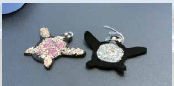
▲ 採取したものを貼り付けるワークショップ