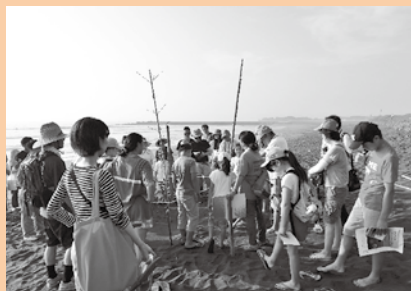
▲ ウミガメの足跡探しツアーの様子