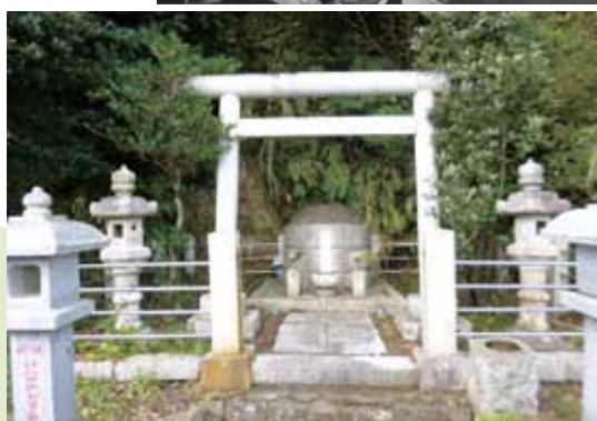
▲ 加納久宜公の墓 (町指定文化財)