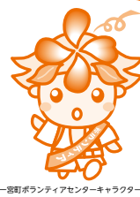
一宮町ボランティアセンターキャラクター「一宮ボックン」

社会福祉法人一宮町社会福祉協議会 ☎ (42) 3424 一宮町ボランティアセンター ☎ (42) 3439