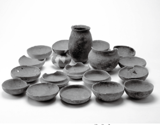
▲ 出土遺物の一部 (土師器ほか)

今回の指定で町の指定文化財は44件となりました。文化財は町の歴史を物語る、かけがえのない貴重な私たちの「たから」です。これからも守り続けていきたいと思います。