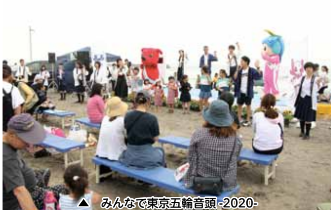
▲ みんなで東京五輪音頭-2020-