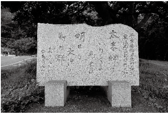
▲ 東浪見甚句碑（東浪見75-1付近）