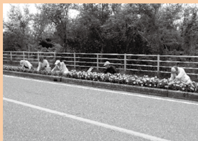
▲ きれいな町づくりを目指します