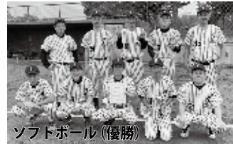
ソフトボール(優勝)