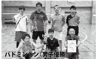
バドミントン(男子優勝)