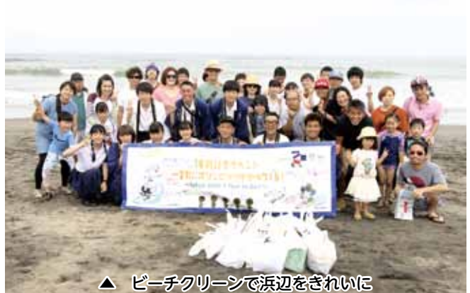
▲ ビーチクリーンで浜辺をきれいに