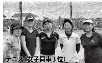
テニス(女子同率3位)