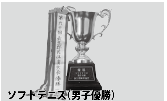
ソフトテニス(男子優勝)