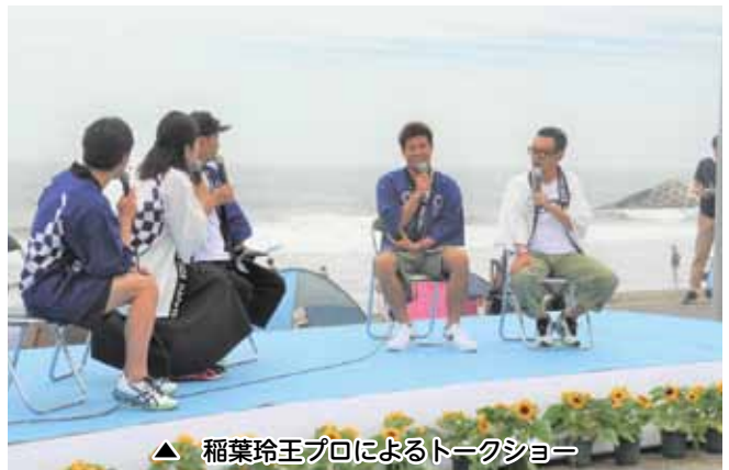
▲ 稲葉玲王プロによるトークショー