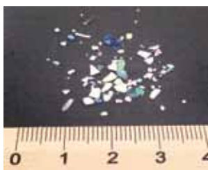
▲マイクロプラスチック片