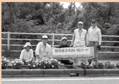
▲ 皆で和気あいあいと活動しています

現在、会員の高齢化に併せ、勤労者等の価値観の変化により会員の減少が続いており、「千葉県道路アダプトプログラムボランティア」への参画も、16区シルバー会や伊勢化学工業の皆さんからご支援・ご協力をいただいで活動しています。私たちの活動にご賛同いただき、共に汗を流して『住み良い地域社会づくり』にご協力していただける会員を募集しています。