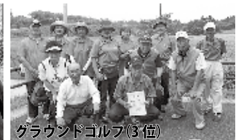
グラウンドゴルフ(3位)

令和になって初めての長生郡民体育大会が長柄町を主管に開催され、6月16日から17競技23種目で熱戦が展開されました。今年は雨にたたられ、テニス男子が中止になるなどスケジュールが大きく変更されて7月28日に全競技が終了。当協会は主力に編成された一宮町は、バドミン