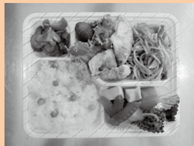
▲ 本日のお弁当 召し上がれ。