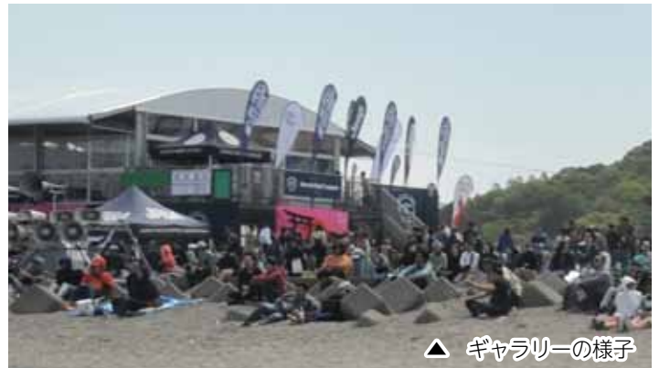
▲ ギャラリーの様子