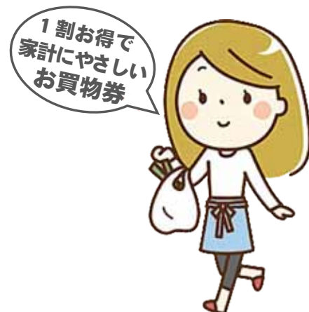
「得々お買物券取扱店」ポスター デザインは一部変更となる場合があります。

発行／一宮町商工会 協賛／一宮町 協力／協同組合一宮スタンプ会 【問合せ】一宮町商工会 ☎ 0475(42)3089