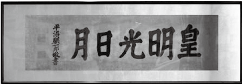
▲平沼の書「皇明光日月」。出典は現存最古の漢詩集『懐風藻』(奈良時代)の弘文天皇(大友皇子)の詩歌とみられる。

写真の扁額は平沼が玉前神社に奉納したものです。現在は玉前神社の参集殿に飾られています。