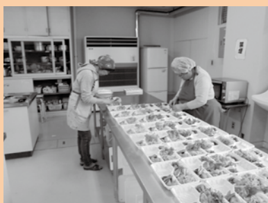
▲ 美味しいお弁当になるように心を込めて作っています。