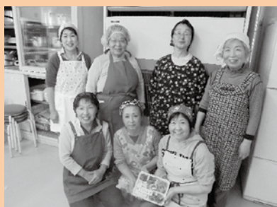
▲ 皆で和気あいあいと活動しています。

その声を参考にしながら、また皆さんの喜んでくださる顔を思い浮かべながら、今後もお弁当づくりをしたいと思えます。