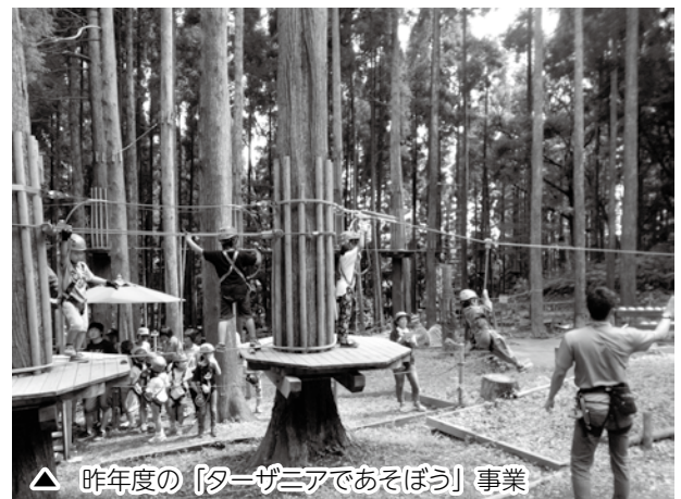
△ 昨年度の「ターザニアであそぼう」事業