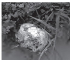
▲ シュレーゲルアオガエルの卵塊 ▲ 成体

【行事案内】 ホテル観察会 6月8日(土) (ホテルの発生が遅れた場合は延期になる場合があります)