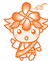
一宮町ボランティアセンターキャラクター 「一宮ポッくん」

社会福祉法人一宮町社会福祉協議会 ☎ (42) 3424 一宮町ボランティアセンター ☎ (42) 3439