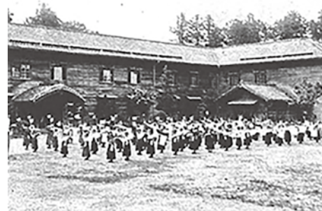
▲ 岩手県師範学校「東宮行啓記念写真帖」(1908) 国立国会図書館デジタルアーカイブより

年（1904）には体育教員を養成する実習校として、荏原中学校（現日本体育大学荏原高等学校の前身）を設立、初代校長として当時の最先端の洋式体育教育の普及に努めました。