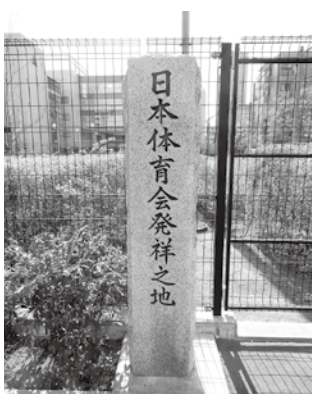
▲ 日本体育会発祥の地石碑 (東京都新宿区原町3丁目)

「いだてん」の中では対立する組織の長として、敵役のように描かれていますが、このように見ていくと、必