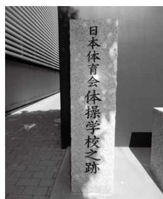
▲ 日本体育会体操学校の跡 (東京都千代田区九段南 1-6-11)

ずしも、体育に否定的であったわけはないことが分かるのではないでしょう。二人の「カノウ」（加納・嘉納）はオリンピックに対する認識こそ違えど、日本を体育・スポーツの面で発展させたいという志は同じだったはず。おそらく「学校教育」の中に位置付けられ始めたばかりの体育を、世界に発信するには時期尚早である、というのが久宜の思いだったのではないのでしょうか。