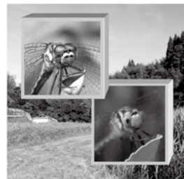
発行：一宮町東部地域保全会・編集：一宮ネイチャークラブ

この冊子は、農林水産省「多自然環境保全型農産物の産地環境保全活動支援事業」の一環として編集されたものです。