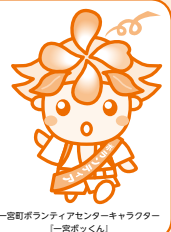
一宮町ボランティアセンターキャラクター 「一宮ポっくん」

社会福祉法人一宮町社会福祉協議会 ☎ (42) 3424 一宮町ボランティアセンター ☎ (42) 3439