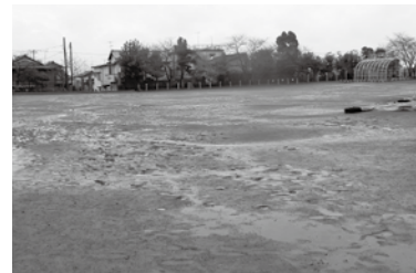
▲ 雨天時の一宮小学校グラウンドの様子