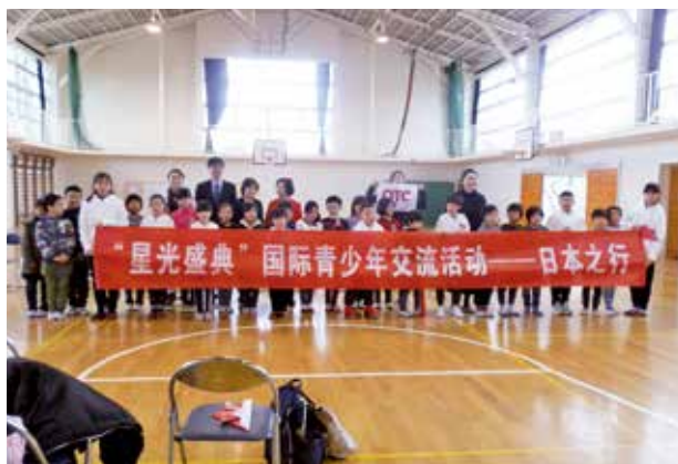
▲ 東浪見小学校・中国の皆さんでの集合写真

東浪見小学校体育館にて、東浪見小学校の児童は中国語で、中国の児童は日本語でそれぞれ挨拶と自己紹介をしました。その後、東浪見小学校の児童が一輪車や歌などを披露し、中国の児童は踊りなどを披露してくれました。また、みんなで縄跳びをしたり歌をうたったりと、子どもたちはとても楽しそうに交流をしておりました。最後に、東浪見小学校の児童と中国の児童でプレゼント交換をし、集合写真を撮り交流会は終了となりました。