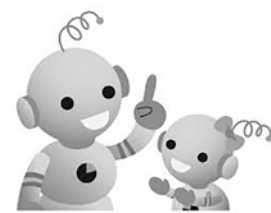
▲工業統計キャラクター コウちゃん・コムちゃん

6月1日は工業統計調査です。製造業を営む事業所を対象に原則、毎年実施しています。5月初旬から6月にかけて調査員が伺いますので、ご協力をお願いします。 ※統計調査員は調査員証を必ず携帯しています。