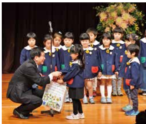
▲ 県知事にひまわりの種を手渡す子どもたち

ひまわりの種は、九十九里・外房地域の保育所や幼稚園、小・中・高等学校、特別支援学校などの約200校に贈られ、それぞれで育てられます。