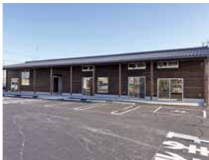
▲ 町の観光拠点施設として情報を発信していきます