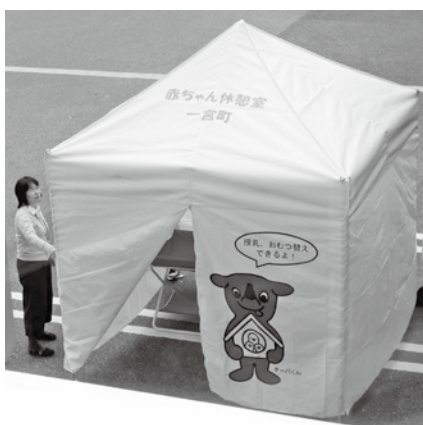
▲ チーバくんのイラストが目印です！