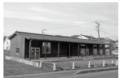
▲ 4月から運営開始する観光拠点施設