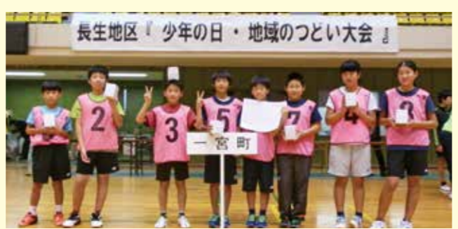
▲「一宮いっちゃん」チームやったね！

トンに挑戦。4人1チームで熱戦を繰り広げた結果、一宮町から出場した「一宮いっちゃん」が優勝しました。