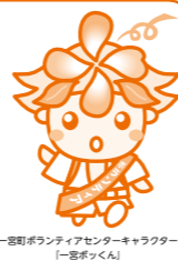
一宮町ボランティアセンターキャラクター「一宮ボックン」

連絡先 社会福祉法人一宮町社会福祉協議会 ☎(42) 3424 一宮町ボランティアセンター FAX(42) 3439