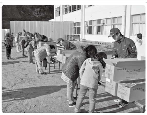
前回の様子(一宮小学校)

町では、大地震、大津波を想定した津波避難訓練を行います。 当日は、防災行政無線で地震、津波発生、避難指示の訓練放送をします。訓練放送の確認後、最寄りの避難所または津波一時避難所へ避難してください。 ※今回の訓練では、大津波警報が発表されたことを想定し、国道から東側に居住する要配慮者の方の車による避難経路や避難時間を確認します。 徒歩で避難できない要配慮者は、車で避難をしてください。