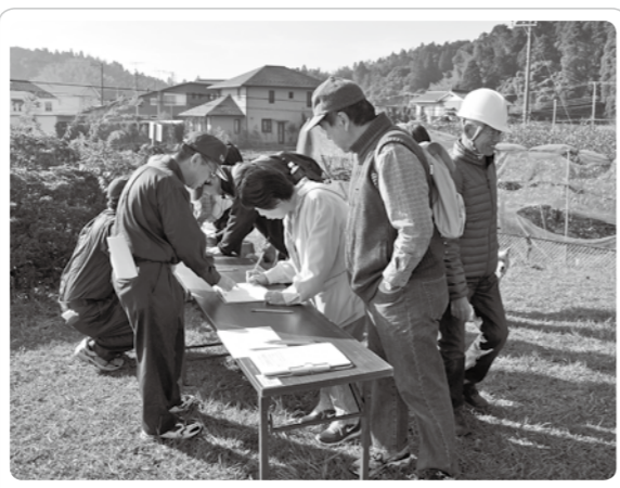
前回の様子(本給望洋公園)