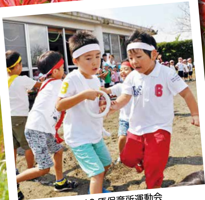
▲ 9.19 原保育所運動会