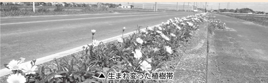
▲ 生まれ変わった植樹帯