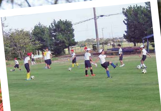
▲ 東浪見小学校のグラウンドが芝生に生まれ変わりました