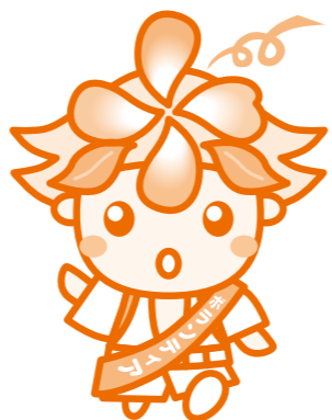
一宮町ボランティアセンターキャラクター「一宮ボックン」

連絡先 社会福祉法人一宮町社会福祉協議会 ☎(42) 3424 一宮町ボランティアセンター ☎(42) 3439