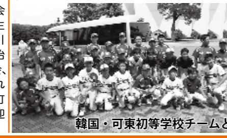
韓国・可東初等学校チームと