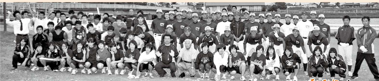
▲ 一宮商業の皆さん、毎年本当に有難うございます

9月24日、九十九里トライアスロン2015に向け、一宮商業高等学校の校長先生をはじめ、先生、生徒約100名の皆さんが、駅から一宮海岸へ行く道路のゴミ拾いを行いました。