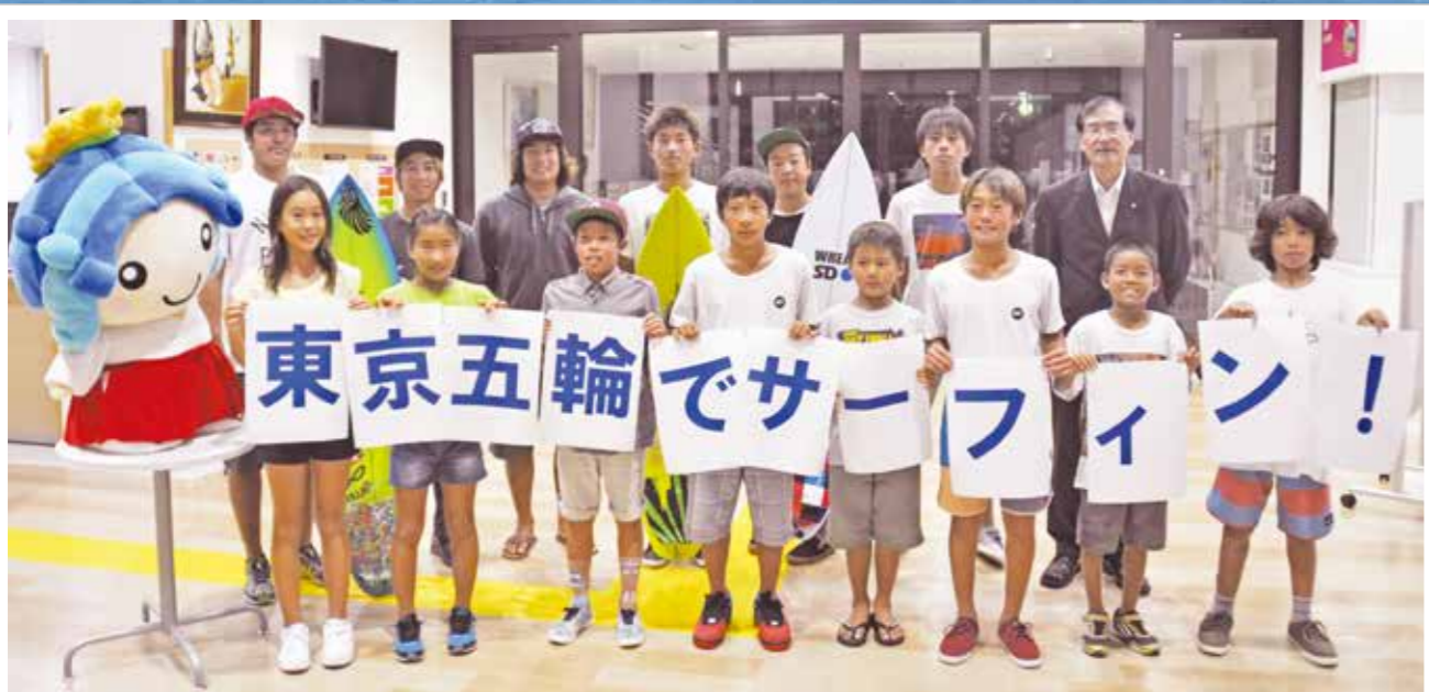
▲僕たち私たちがオリンピックに出場できるよう応援宜しくお願いします!!!