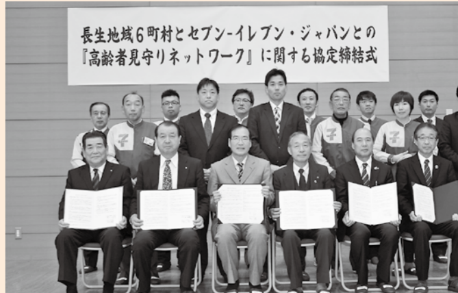
▲「セブン-イレブン・ジャパン」との協定締結式