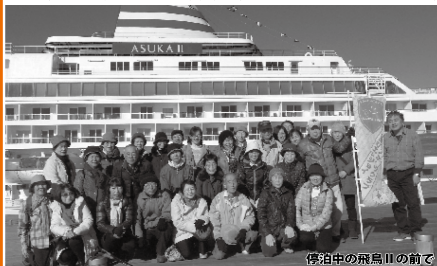
停泊中の飛鳥IIの前で

町民バスいちのみや号で行くエンジョイスポーツクラブ恒例の郊外ウォーキング、今回は12月14日、師走の横浜港を訪れました。40代から最高齢82才までの総勢32人。コースは中央公民館を午前8時にスタート、海ほたる～大棧橋～赤レンガ倉庫～野毛山公園～中華街～港の見える丘公園～山下公園～大棧橋～海ほたるを経て中央公民館に午後5時30分着、全長11kmのコースを昼食の時間を除けば3時間弱で、みな楽しく、落伍者なく歩き通しました。ウォーキング中はお互い声をかけあって笑い声の絶えないウォーキングとなりました。