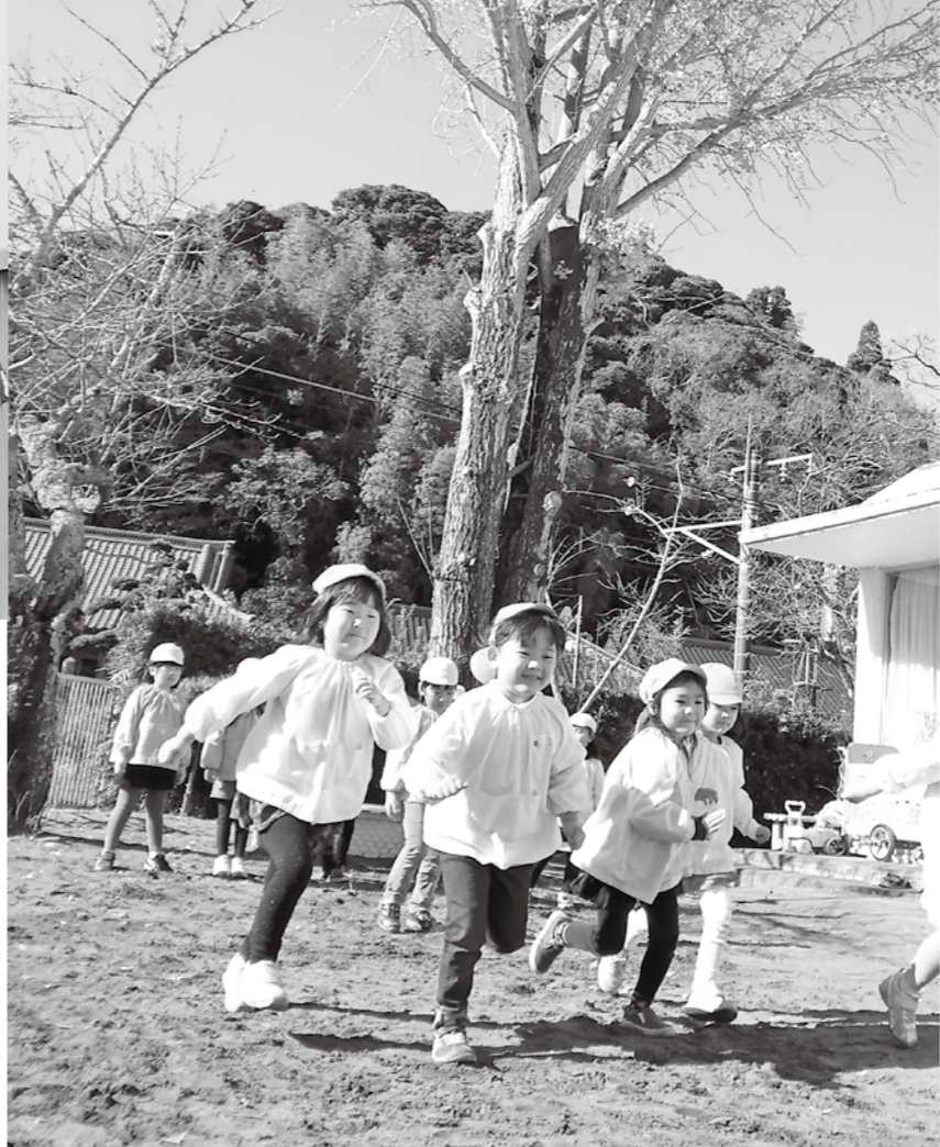
▲ 移設が決まった東浪見保育所

町長 町が特に力を入れている子育て支援ですが、昨年は医療費の助成を高校3年生まで拡大いたしました。今年