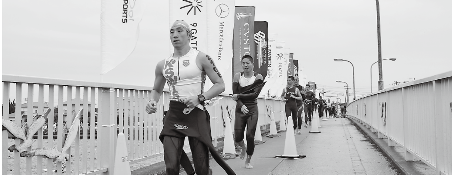
▲ 日本最大規模の九十九里トライアスロン

議長 今年は、羊年です。羊は同じ行動を取って大勢で暮らすことから、家族の安泰を示し、いつまでも平和に暮らすことを意味しているそうです。町民の皆さんが、平和で安心して暮らせるよう、議員一同、身を粉にして努力してまいりますので、今後ともご協力を賜りますようお願い申し上げます。