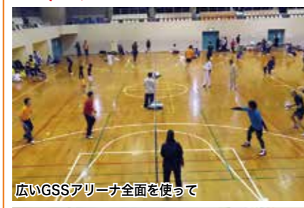
広いGSSアリーナ全面を使って

●2月23日 第6回一宮町バドミントン大会 今回で6回目のこの大会、初めてジュニアシングルス(小学生以下対象)の部も設け、大人から小さな子供までが楽しめる大会としたことで、長生郡市以外からの参加も多くあり、出場者数も80人と今までで一番多い大会となりました。当日は気温が低かったものの、汗をかきながらの熱戦の連続となり、寒さを吹き飛ばしてしまいました。