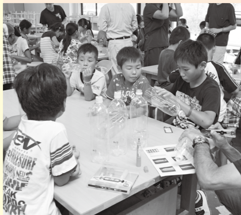
▲サマーキャンプは毎年、子どもたちに大好評！

夏休みも終盤の8月24、25日の2日間、船橋市一宮少年自然の家で、子ども会サマーキャンプが開催されました。