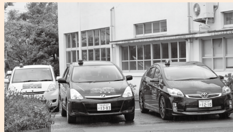
▲地域の安全を見守るパトロール隊

9月11日に一宮学園で出発式が行われ、子どもたちの登下校時の見守り、危険個所の見回り、青色回転灯を点灯した夜間パトロールを実施していただくことになりました。