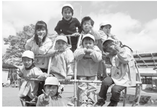
一宮町の保育所(園)