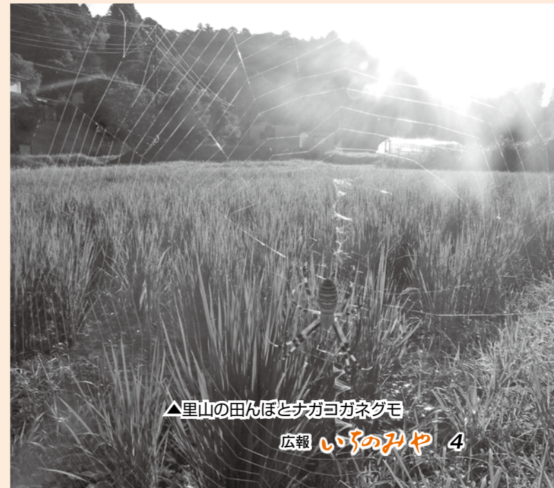
▲里山の田んぼとナガヨガネグモ

【問合せ】 戸張 ☎(42) 3852 三芳堂 ☎(42) 4345 ㊟(42) 6009