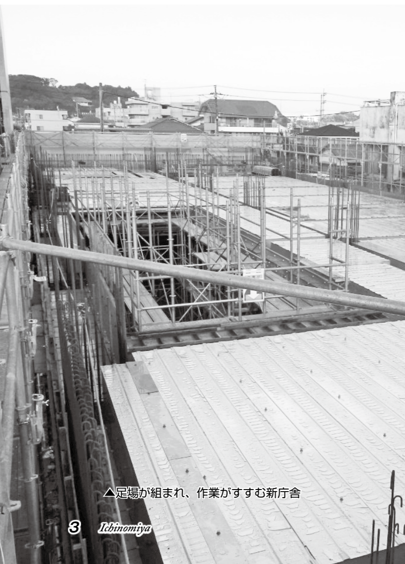
△足場が組み立てられ、作業がすすむ新庁舎

なお、工事の様子については町ホームページの『新庁舎建設工事の進捗状況』で適時紹介しています。 【問合せ】まちづくり推進課 ☎(42)2113