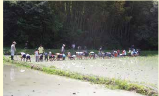
▲みんな泥んこで田植え体験

【行事案内】 7月7日(日) 水生生物観察会 & ザリガニ釣り大会 【問合せ】 戸張 ☎(42) 3852 三芳堂 ☎(42) 4345 ㊟(42) 6009