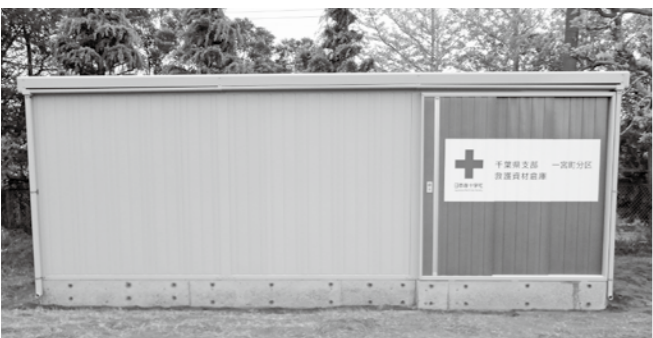
災害救援物資等保管倉庫(一宮中学校敷地内設置) (幅3m、奥行7m、高さ2.5m)