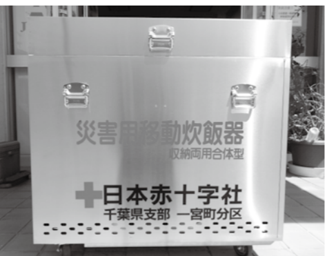
災害用移動炊飯器 (約40分で100人分の炊き出しが可能)