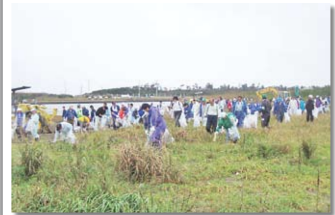
一宮川河口で清掃活動する皆さん

郡内の企業・団体・県・市町村の社員・職員及びボランティアのみならず総勢380人による、第3回、一宮川河口クリーン事業が、10月23日に行われました。 この清掃活動により、トラック8台分約1トンのごみを処理しました。参加されたボランティアのみならず、一宮川等流域環境保全推進協議会は、今後も清掃活動を継続的に行っていきます。