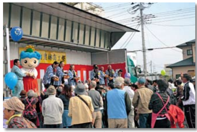
恒例の祝い餅投げ！