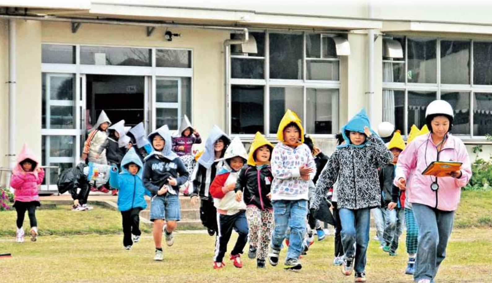
東浪見小学校児童

それ逃げ、遍照寺まで逃げるぞ!! 11月28日に全町を対象とした地震・津波を 想定しての避難訓練を実施しました。