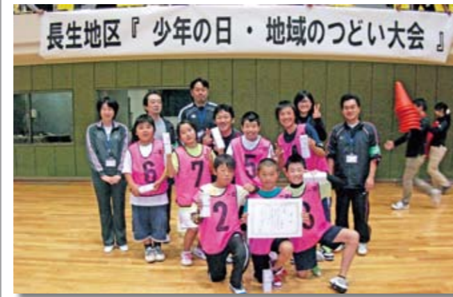
みんなで力を合わせて優勝！

「少年の日・地域のつどい大会」(長生地区青少年相談員連絡協議会主催)が、11月6日に茂原市民体育館で行われ、120人の子どもたちがスポーツを楽しみました。この催しはスポーツを通じて友情と親睦を深め、体力作りをする目的で毎年開催されています。 今年は小学生がファミリーバドミントンに挑戦。一宮Aチームがみごと優勝しました。