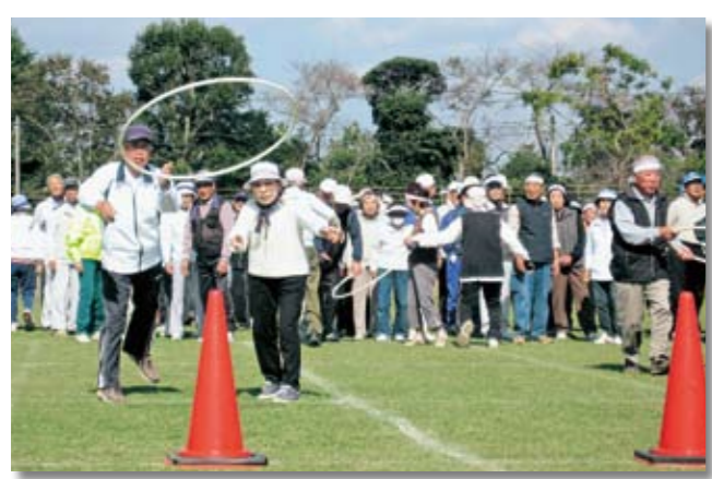
息をあわせて仲良く輪なげ

町の特産物のPRや町民と生産者との交流等を目的とする農林商工祭が、11月3日一宮町保健センター前で開催されました。 会場では農産物や加工品などの展示即売や、金魚すくい、スパーボールすくいなど楽しいイベントも行われ、子どもたちの人気を集めていました。 当日は、天候にも恵まれ、温かい日差しの中、大勢のお客さんが訪れ大盛況でした。