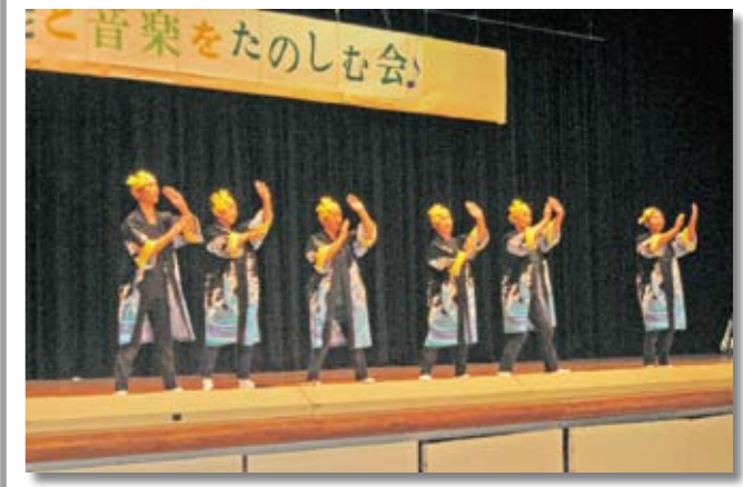
息の合った踊りを披露する咲雀会

芸能と音楽を楽しむ会と文化祭（総合文化祭）がGSSセンターで行われ、大勢の観客が訪れました。 10月30日の芸能と音楽を楽しむ会では、21団体755人が日ごろの練習の成果を披露し、招待した選歴者も含めた観客を魅了しました。 11月5、6日の文化祭では、様々な芸術作品が展示され、期間中は千二百人を超える来場者が、文化芸術に親しむひとときを過ごしました。