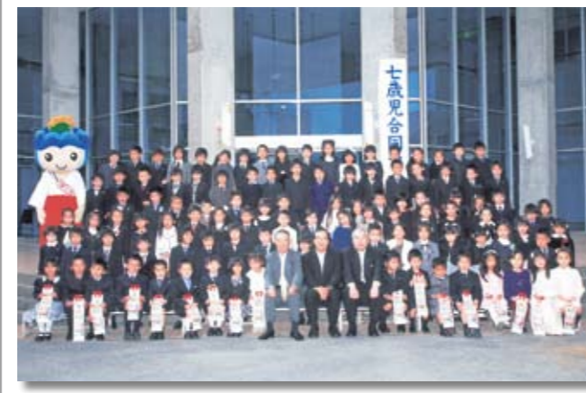
みんなでスマイル

七歳児合同祝いが中央公民館で11月15日に開催され、来年少生になる103人の子どもたちをお祝しました。 式典に続いて、千葉県警交通課による交通安全教室と、本物のパトカーや白バイの乗車体験が行われ、子どもたちは大喜び。最後は、いっちゃんと一緒に、爽やかな秋空の下で笑顔の集合写真となりました。