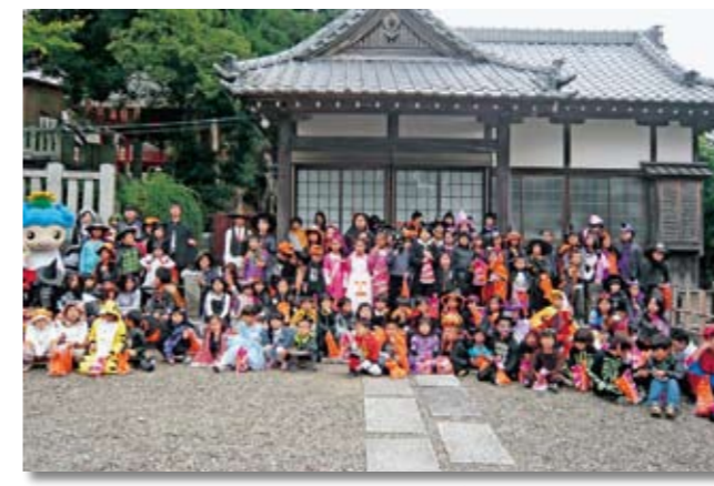
オバケと魔女が大集合