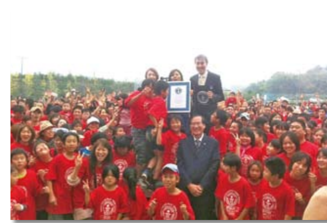
ギネス世界記録公式認定証を授与され喜ぶ参加者

毎年恒例のハロウィンパレードが10月30日に行われ、220人の子どもたちが仮装して町内を歩きました。 魔女やオバケなど、かわいい衣装に身を包んだ子どもたちが、「お菓子をくれなきゃ、いたずらしちゃうぞ」と言いながら町内の国道沿い商店街を順番に回り、飛び入り参加でいっちゃんも一緒に参加して、お祭りを盛り上げました。