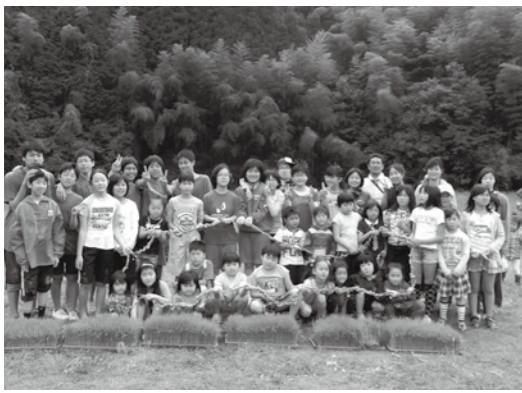
みんなで仲良く田植え体験!