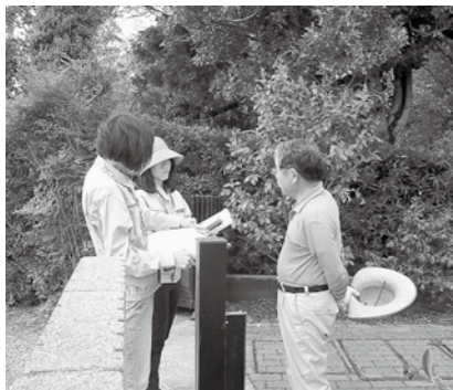
実態調査の聞き取りを行う非常勤職員

また、プロワーカーの電源をきらないこと、台所からの排水で油脂類はできるだけ流さないこと、浄化槽の上部又は周辺には物を置かないことなどです。米のとき汁については、植木にあげると良いです。