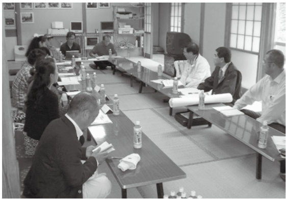
新浜区町長座談会

これは、地域の課題や要望などを直接町長が伺い、行政施策に生かしたいとの思いから実施しているもので、既に、8区の1、1区、9区の2、3〜6区、新浜区が実施されました。今後も7月にかけて8つの地区で実施が予定されています。