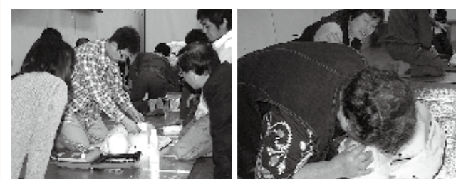
▲AEDの扱い方は慎重に ▲人工呼吸は初めての人が多かった