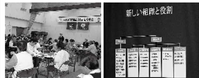
▲中央公民館大会議室も満員 ▲これからの方向をスライドで説明