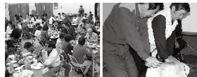
▲懇親会はお酒抜きで和やかに ▲南消防署員による救命救急講習会