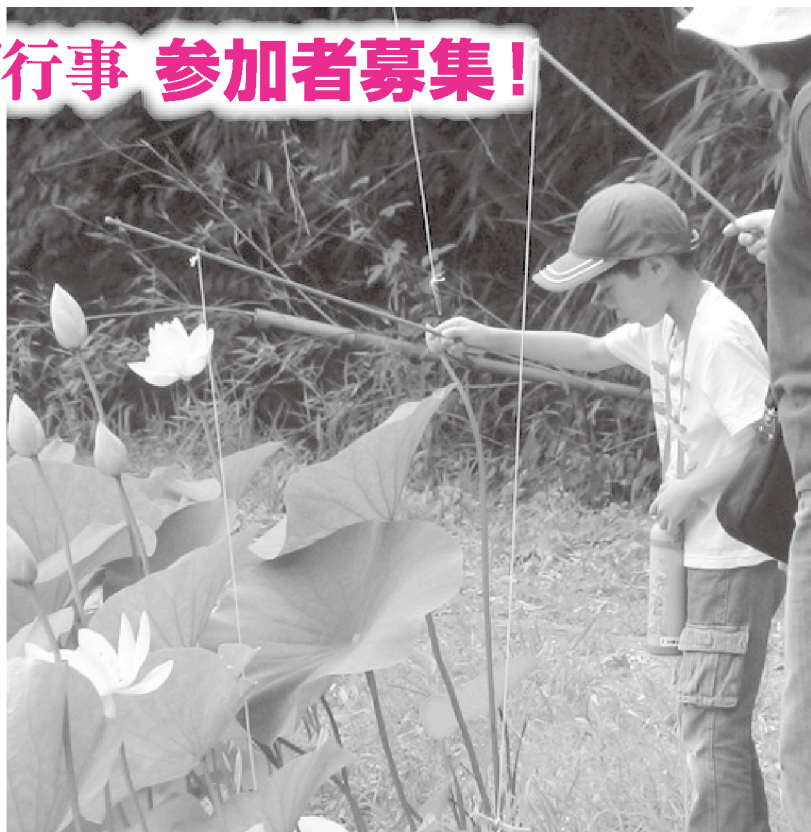
▲ 100匹? 200匹? だれがたくさん釣れるかな