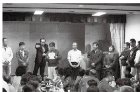
懇親会でのクラブ紹介