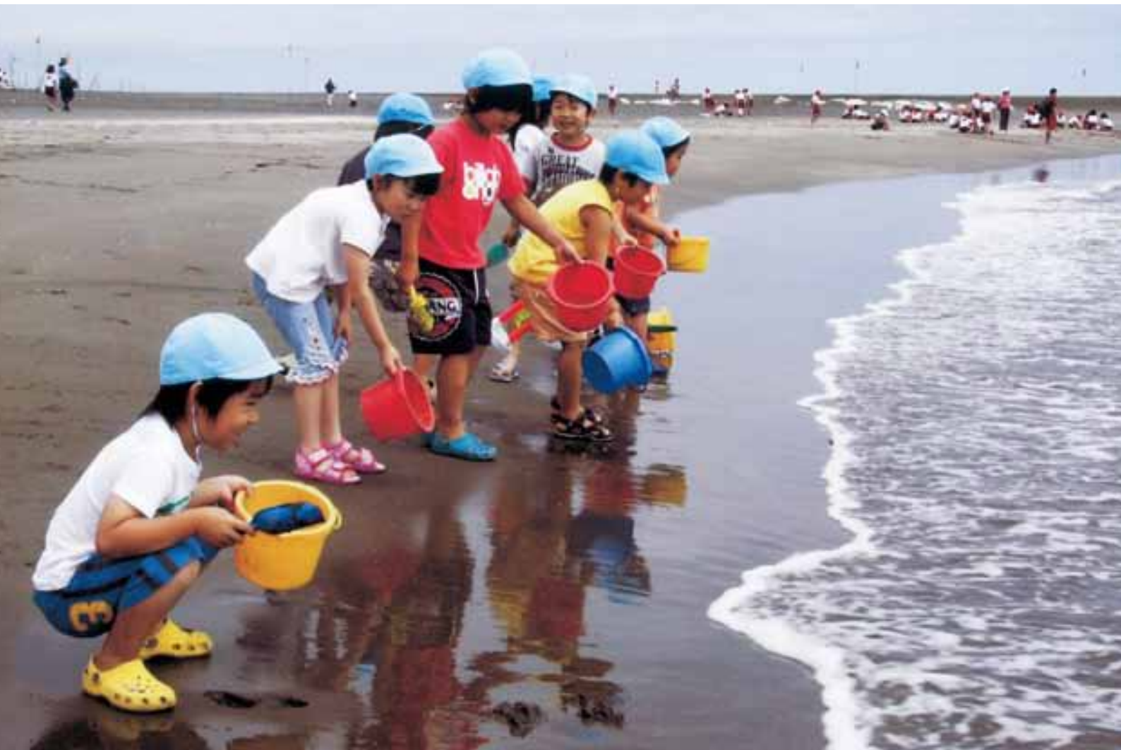
夏本番 海遊び!! (東浪見保育所)