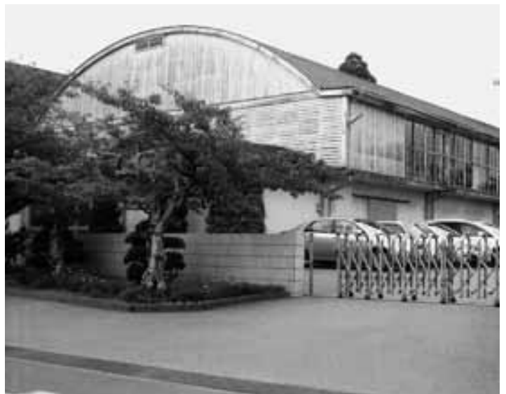
改修が待たれる一宮中学校体育館

平成21年度の国保税の本来算定期をむかえているが、今年こそ一世帯2万円の引き下げをして、取り過ぎた税を還元すべきである。昨年は歳入不足が生じる