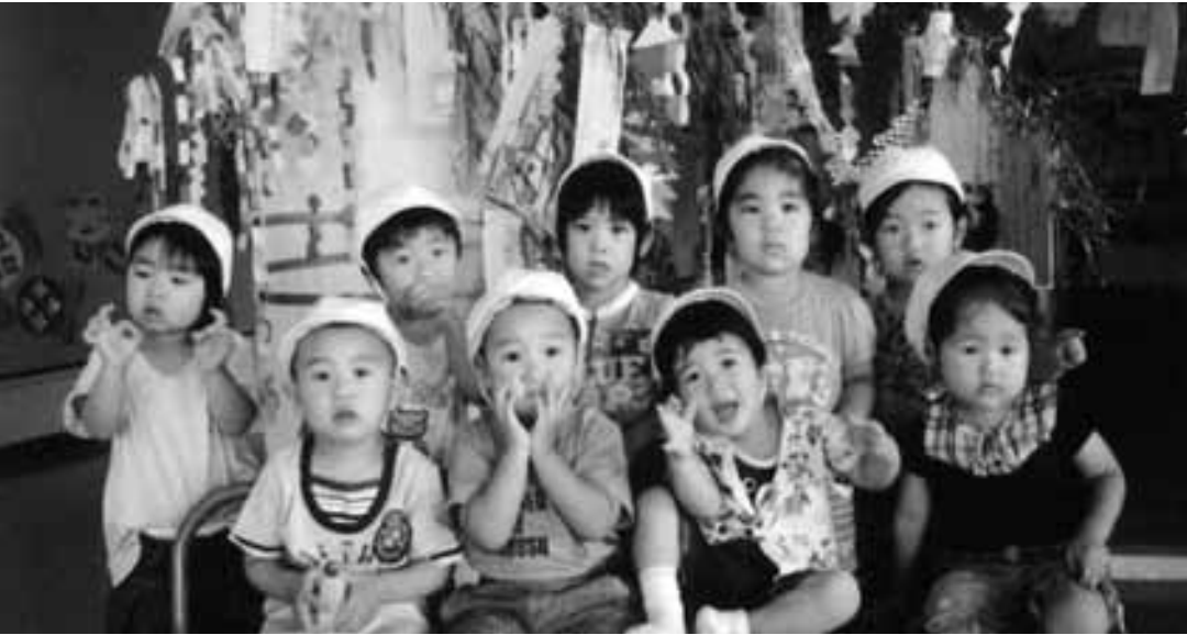
七夕祭り（原保育所）

また、議案として条例の制定・一部改正など4件、補正予算については一般会計他7会計が原案どおり可決しました。