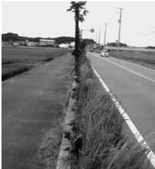
県道一宮停車場線

玉川町長 この道路は、安全対策と同時に町の活性化としても重要な課題と考えている。