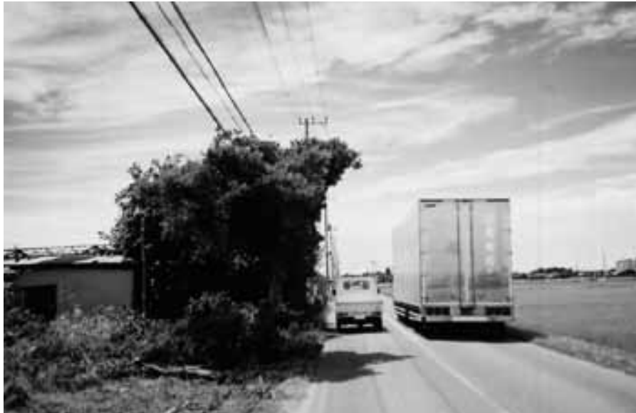
歩道のない町道 1-7 号線 (船頭給地先)

けで根本的な解決に至っていない。太東岬、いすみ川の護岸工事などを進めた結果、砂の供給が止まった事が起因していると考えられ、人工的に砂を入れて砂浜をつくる養浜事業計画を進めている。 津波対策の防潮堤設置は、雄大な計画であり、できればすばらしい。関係市町村とも協議をし、事業主体となる国・県の意見を聞き検討したい。