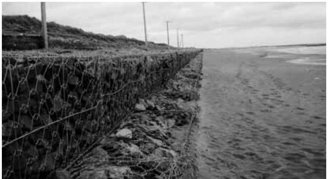
浜崖崩落の続く海岸線

けで根本的な解決に至っていない。太東岬、いすみ川の護岸工事などを進めた結果、砂の供給が止まった事が起因していると考えられ、人工的に砂を入れて砂浜をつくる養浜事業計画を進めている。 津波対策の防潮堤設置は、雄大な計画であり、できればすばらしい。関係市町村とも協議をし、事業主体となる国・県の意見を聞き検討したい。