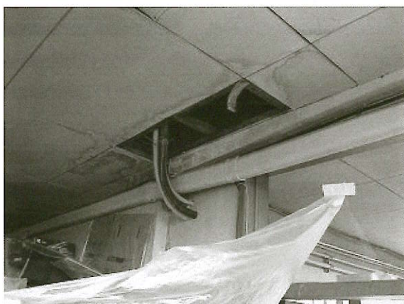
屋上防水機能の劣化による雨漏り

多くの町民が訪れる庁舎であるため早急に安全性を確保し、また災害時には災害対策本部として、町民の安全を守る機能を有していることから、十分な安全性を確保した庁舎建設が必要です。