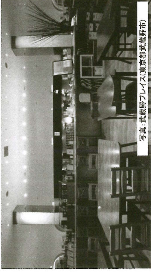
写真: 武蔵野プレイス(東京都武蔵野市)