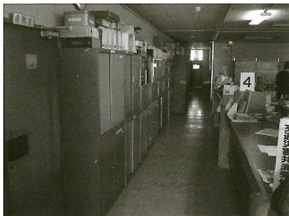
通路に置かれた書類棚

行政の役割が多様化するにつれて、窓口や待合スペース・会議室・倉庫などに必要な面積が増え、業務に必要な部屋の数が不足するなどの影響が出ています。また、町民が人には知られたくない内容を相談するスペースが確保できないため、プライバシーや個人情報を保護しにくい状況も見受けられます。