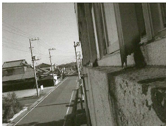
耐震補強部品の腐食