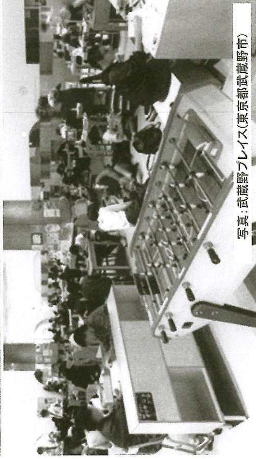
写真: 武蔵野プレイス(東京都武蔵野市)