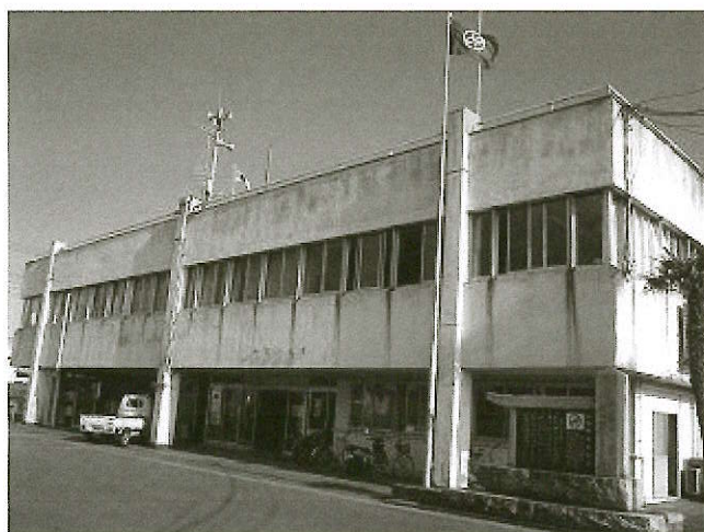
一宮町役場本庁舎(昭和42年建設)

このような状況の解決は、本町にとって長年の懸案事項であり、これらの問題を解消するため、新庁舎の建設について検討を行ってきました。「一宮町新庁舎建設基本構想・基本計画」は、これまでの新庁舎建設をめぐる検討を踏まえて、本町が目指す庁舎像を明らかにし、新庁舎建設の指針となる基本的な考え方を示すものであり、今後策定される「基本設計」「実施設計」において、より詳細な検討・設計を行う際の指針となるものです。