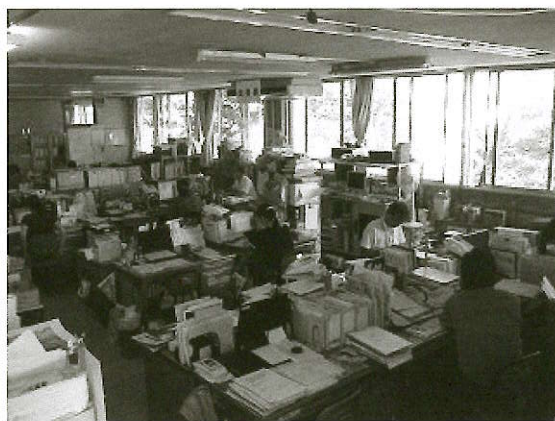
狭い事務スペース