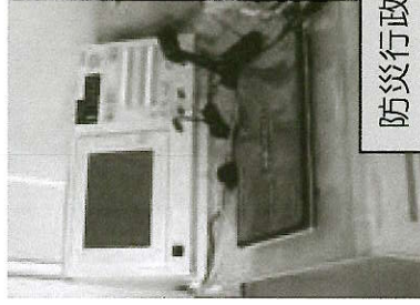
防災行政無線のデジタル化