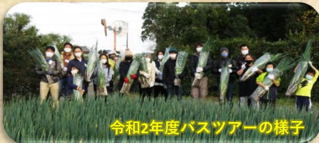
令和2年度バスツアーの様子