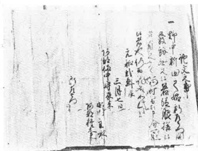
野中新田開発の文書 (野中近藤家所有)

二寸九分つめてゐる。田畠の等級も上、中、下、下下の四等級から、上ノ上、上、中、下、下ノ下の五級とし、段別課税から石高課税をとり、粗納から玄米納にしている。検地する場合は検地奉行、勘定役、目付、代官、帳役、祐筆、卒役、賄役、地見役、惣案内、村案内が領主から任命される。一宮本郷周辺の検地は天正十九年、慶長六年、文禄二年、延宝七年、享保十三年、享保二十年、安永三年、嘉永七年に行われた。太閤検地以前の検地を「古検」といい、以後の検地を「新検」という。また享保二十年、安永三年、嘉永七年新田開発検