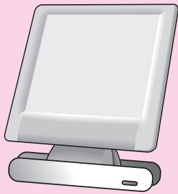
液晶テレビ、プラズマテレビ