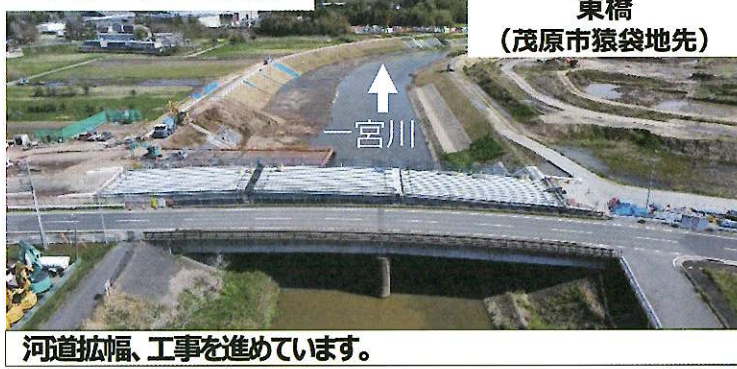
河道拡幅、工事を進めています。