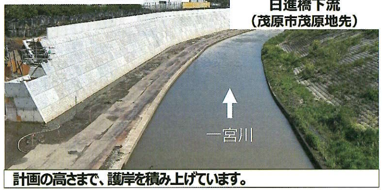
計画の高さまで、護岸を積み上げています。