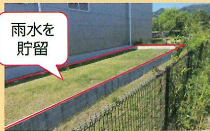
雨水貯留浸透施設(表面貯留)の事例

許可申請手続きについては「 雨水浸透阻害行為の許可申請の手引 」をご覧ください。