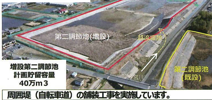
周囲堤(自転車道)の舗装工事を実施しています。