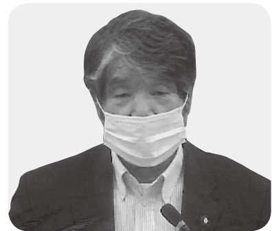
袴田 忍 議員

問 新型コロナウイルス感染症によって一般企業・飲食店等の臨時休業により、職を失った人も多い。特に深刻なのは、非正規雇用で生活を支えていた人達である。