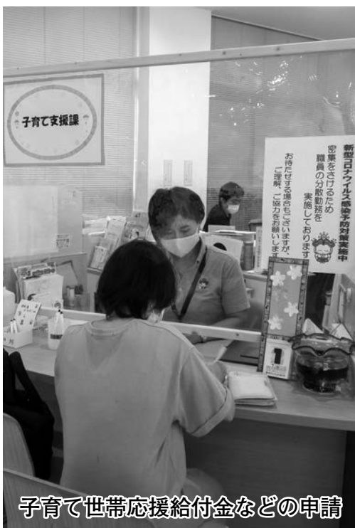
子育て世帯応援給付金などの申請