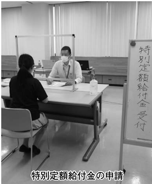
特別定額給付金の申請

新型コロナウイルス感染症の感染拡大による町財政と地域経済への影響を考え、町長の給料月額を毎月50万円、副町長と教育長の給料月額を毎月5万円減額します。 減額の期間は、令和2年6月から令和3年3月までの10ヶ月間で、合計600万円減額します。