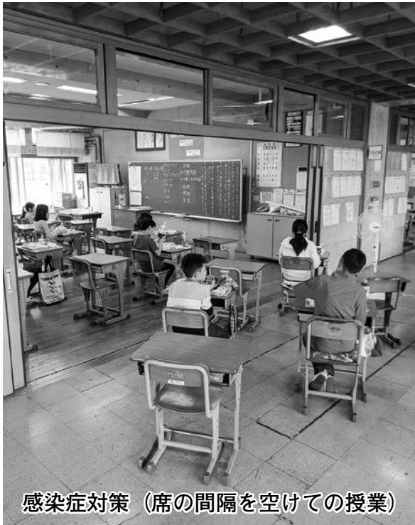
感染症対策 (席の間隔を空けての授業)

問 学校休業時の学校・家庭での状況と今後の方針について伺う。 ① 休業中の状況は。 ② 今年度の方針は。 ③ ネット利用によるオンライン授業などの実態と、学校外での学習の機会整備と環境の充実を進めるべきと考えるが、どう対応してゆくのか。